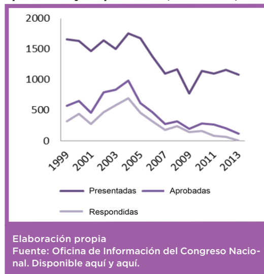
Gráfico 2. Solicitudes de información presentadas, aprobadas y respondidas (1999-2014)

La información disponible muestra que el número total de solicitudes de información elevadas y aprobadas está decayendo desde 1997. De manera similar, el número de respuestas por parte del ejecutivo decrece desde el año 2005.